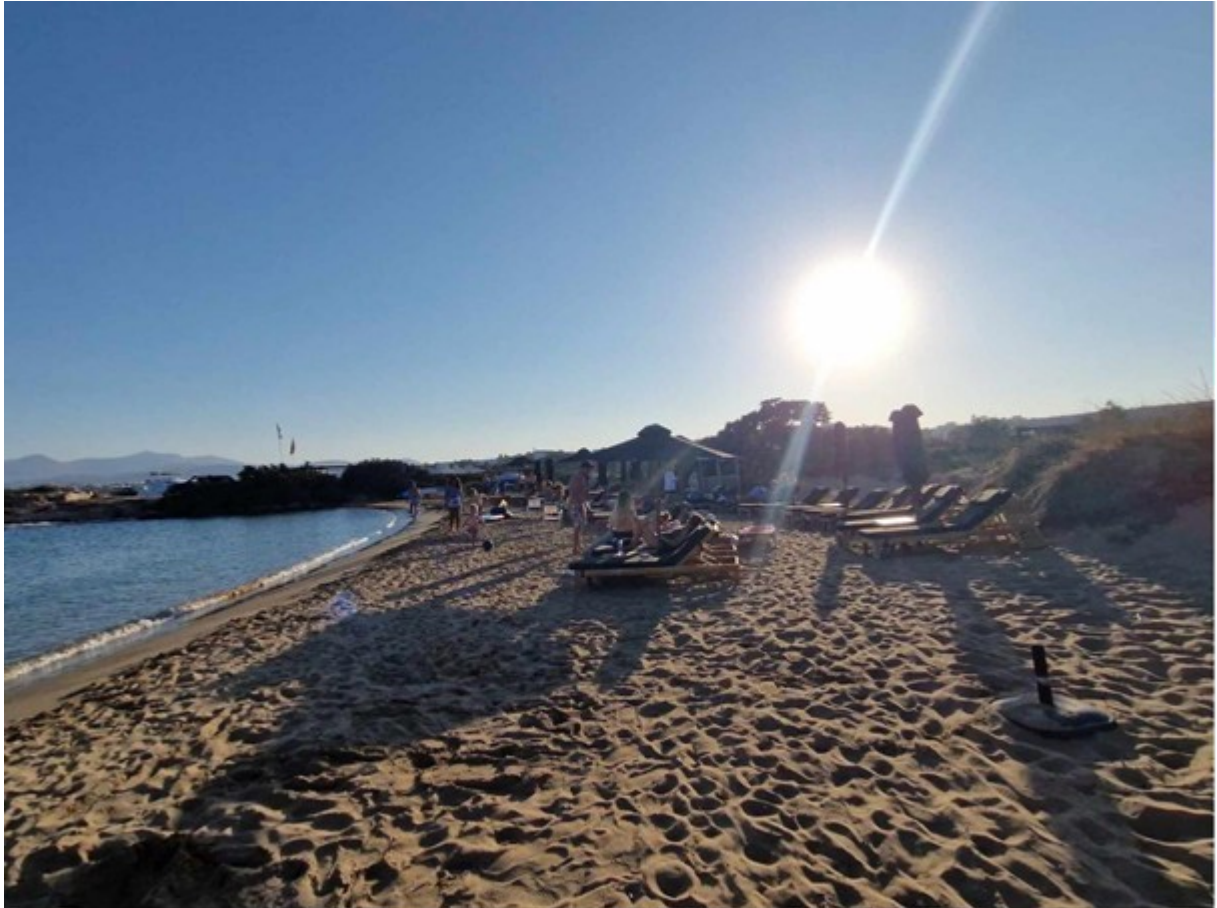
Μικρή Σάντα Μαρία, φέτος με ελεύθερο χώρο

Παραλίες: Καταγγελίες και πρόστιμα άνω των 350.000 ευρώ για παραβάσεις - ΤΟ ΒΗΜΑ (tovima.gr)